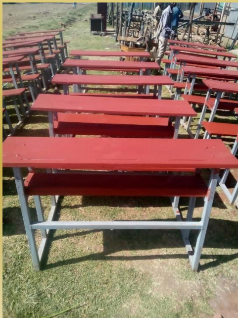
Neue Bänke und Stühle für den ersten Schulraum ersetzen die alten (oben); Sommer 2018